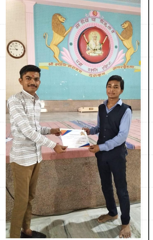
સુંદર અક્ષર સ્પર્ધા