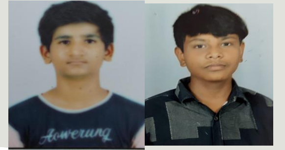
યશ ધંધૂકીયા નૈતિક શાહ રમત ગમત કેપ્ટન