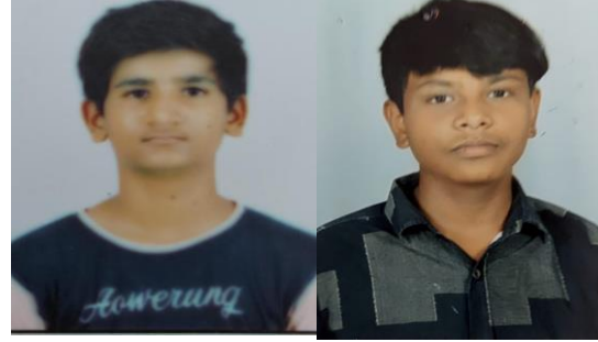
યશ ધંધૂકીયા નૈતિક શાહ રમત ગમત કેપ્ટન